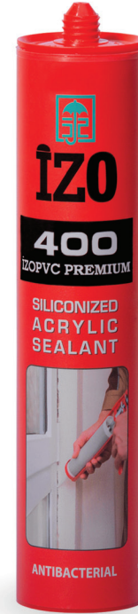
درزگیر سیلیکون ماستیک ایزو IZO PVC 400 500 gr

Description : It is one component siliconized acrylic based sealant and insulation material which has excellent adhesion and elasticity.