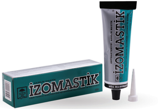
درزگیر سیلیکون ماستیک پمادی ایزو IZO MASTIK 200 gr