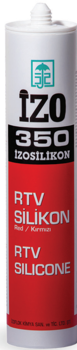
سیلیکون واشر ساز حرارتی ایزو