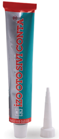
سیلیکون واشر ساز پمادی ایزو

- ممکن است باعث ایجاد خوردگی روی برخی فلزات حساس مانند (برنج،مس، روی) و همچنین مرمر و سنگهای طبیعی دیگر شود .