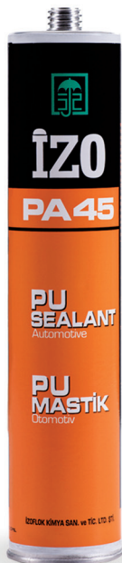
درزگیر پلی اورتان کارتریجی