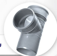
سه راه ۹۰ درجه TEE 90