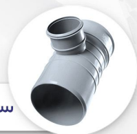
سه راه تبدیل ۹۰ درجه TEE CONVERTER 90