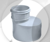
تبدیل غیر مرکز CONVERTER