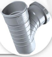
سه راه خم دریچه بازدید تک سر کوبله