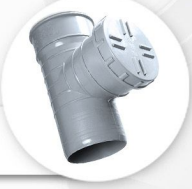
سه راه دریچه بازدید