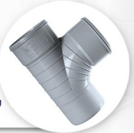
سه راه خم ۸۷/۵ درجه TEE 87/5